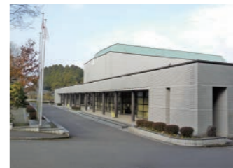
①末吉総合センター

②鹿児島空港から50分(高速) 鹿児島中央駅から60分(高速) 知覧特攻平和会館から110分(高速) 指宿市から130分(高速)