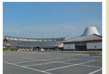
②おおすみ弥五郎伝説の里